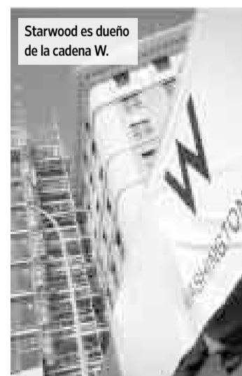
Starwood es dueño de la cadena W.